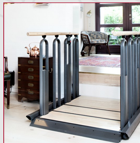
Fig. 2 : Position élévateur